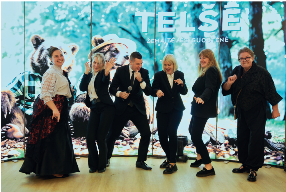
Žemaitijos TIC komanda renginyje „Sutarkime 2025“

naktį, „Cėbolinės jiedėma tornirā, Pasaulinę turizmo dieną „Sutarkime“ kartu su turizmo sezono uždarymu ir rezultatų aptarimu bei nusipelnusių turizmui pagerbimu. Šiais metais šie renginiai išliks, tačiau bus dar didesni – su naujomis idėjomis ir netikėtais potyriais – kviesime turistus ir rajono gyventojus į juos įsitraukti ne tik kaip žiūrovus, bet ir kaip dalyvius. Taip pat siūlysimė įvairių žaidimų, atrakcijų, savaitgalinių akcijų. Pavyzdžiui, organizuosime daiktų, susijusių su Telšiais, slėpynes, kuriose dalyviai galės ne tik smagiai praleisti laiką spręsdami užduotis, bet ir laimėti prizų. Šiomet išleidome dar vieną naują lankstinuką. Šįkart jis susijęs su maitinimo paslaugomis ir, žinoma, jame ne-