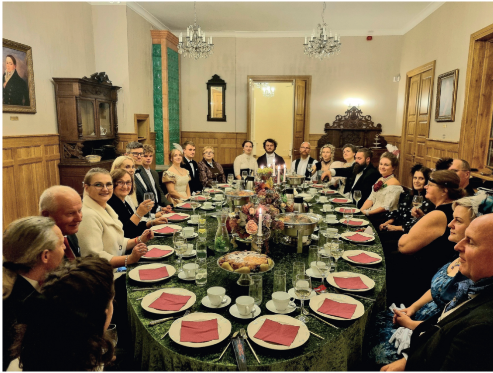
Grafų vakarienė nepalieka abejingų

Visada lyginu dvaro laikų gyvenimą su šiandiena – kas pasikeitė, o kas išliko panašu. Tokie palyginimai padeda lankytojams lengviau įsivaizduoti praeitį, istorija tampa artima ir suprantama, o