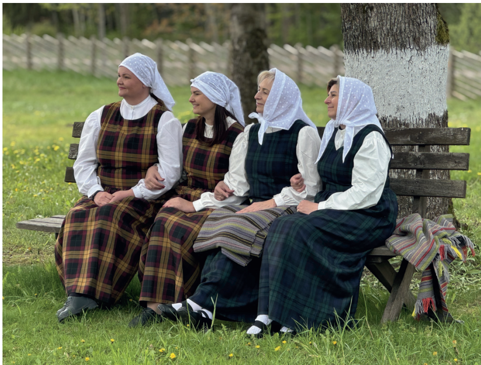
Žemaičių kaimo muziejaus darbuotojos

1982 m. muziejus jau atvėrė duris lankytojams. Per kelis dešimtmečius jis išaugo į antrą pagal dydį buities muziejų Lietuvoje po Rumšiškių. Šiandien čia stovi pastatai, kuriuose įrengtos ekspozicijos su autentiškais baldais, darbo įrankiais, buities reikmenimis ir indais. Trobų interjerus puošia kryžiai, paveikslai ir kiti senąją kaimo aplinką atspindintys daiktai.