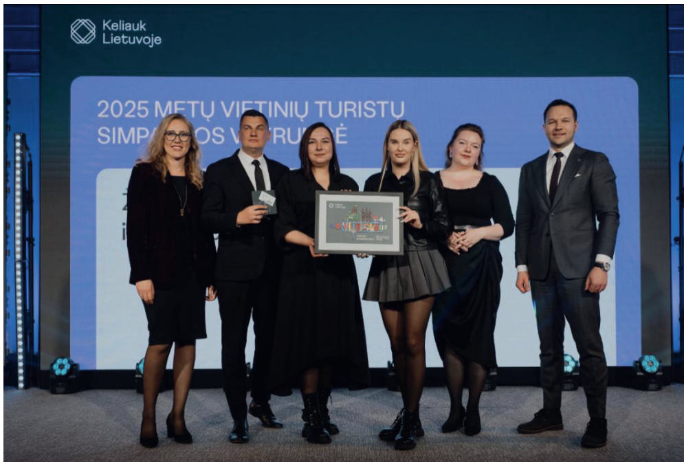
„Lietuvos simpatijų turistų vėtrungė“ atiteko Žemaitijos TIC komandai

Na, kiekvienais metais organizuojame įvairiausių renginių, tokių kaip „Sūrio gaudymo čempionatas“, turizmo sezono atidarymas. Taip pat rengiame turizmo