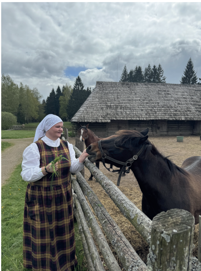
Muziejaus teritorijoje ganosi žemaitukai