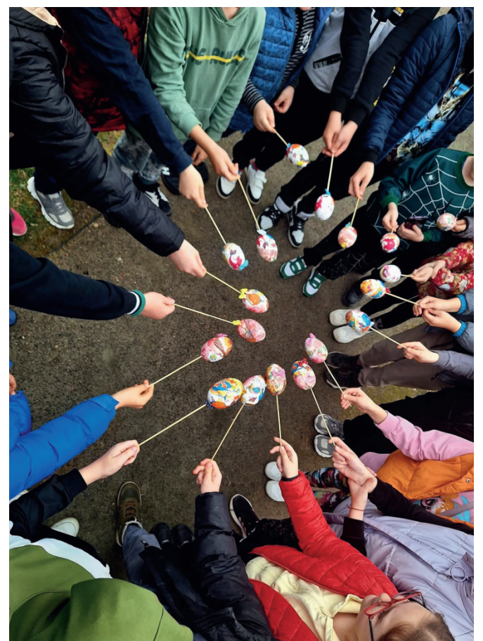
Dvare vyksta įvairios edukacijos