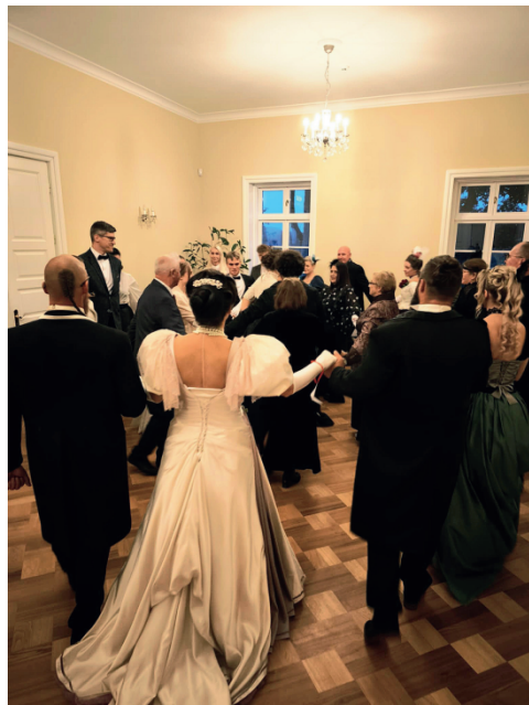
Akimirkos iš istorinio Gorskių balius