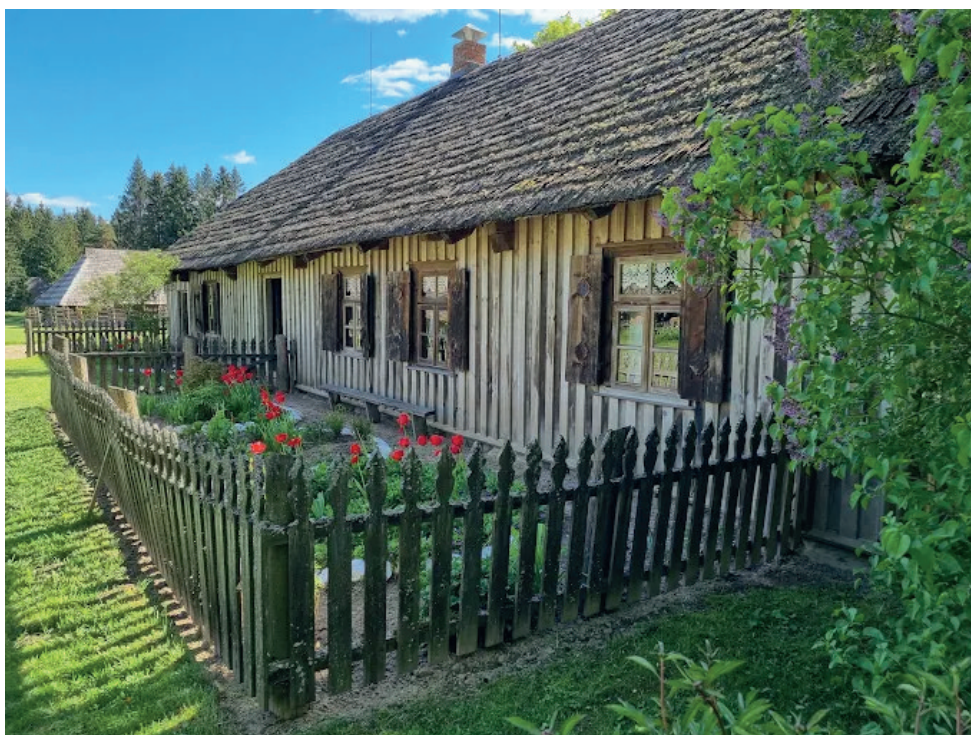
Šiame muziejuje galima pasijusti kaip tikrame kaime

į Žemaičių kaimo muziejus – neskubėti. Čia nereikia skaičiuoti minučių ar bėgti nuo sodybos prie sodybos – kiekviena troba, kiekvienas kampelis, kiekviena medinė tvorelė ar senas daiktas turi savo istoriją, kuri atsiskleidžia tik tuomet, kai sustoji. Žingsnis po žingsnio klaidžiodami takeliais, palydėdami akimis malūno sparnus, klausydami gyvūnų