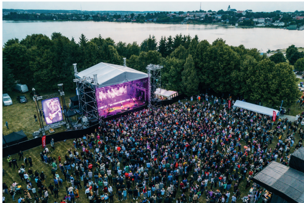
Akimirkos iš Žemaitijos sostinės šventės „Telšė linGOun“ 2025