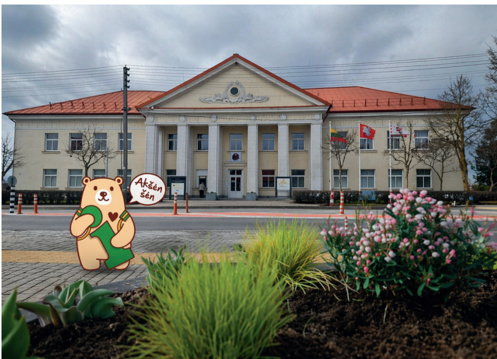
Žemaitijos turizmo informacijos centro padalinys Varnių seniūnijoje

palikimą: čia eksponuojami auksakalystės dirbiniai, liturginė tekstilė, meno kūriniai, archeologiniai radiniai bei dokumentai. Autentiškos erdvės leidžia lankytojams pajusti Lietuvos Didžiosios Kunigaikštystės laikų dvasią ir geriau suprasti šio krašto istorinę svarbą. Varnių vardas neatsiejamas ir nuo iškilų asmenybių. Viena svarbiausių – Motiejus Valančius, kurio 225-osios gimimo metinės minimos šiemet.